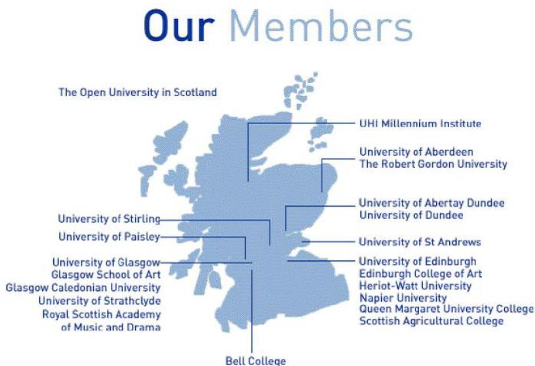
Mynd 1. Háskólar sem eru þátttakendur í The Open University in Scotland ( http://www.universities-scotland.ac.uk/Map/Map.html ).

Mynd 1 sýnir þá Háskóla í Skotlandi sem taka þátt í fjarkennslu og eru þar af leiðandi hluti af The Open University in Scotland.